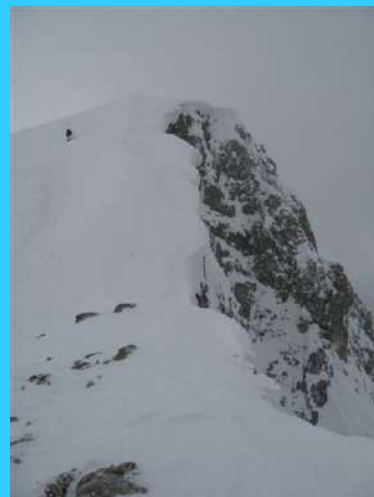
Greben i strehe